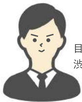
目黒在住 渋谷勤務のAさん

「いつ・どこ」を指定すればスマホの位置情報を二ヶ月前迄データを遡って取得し配信。